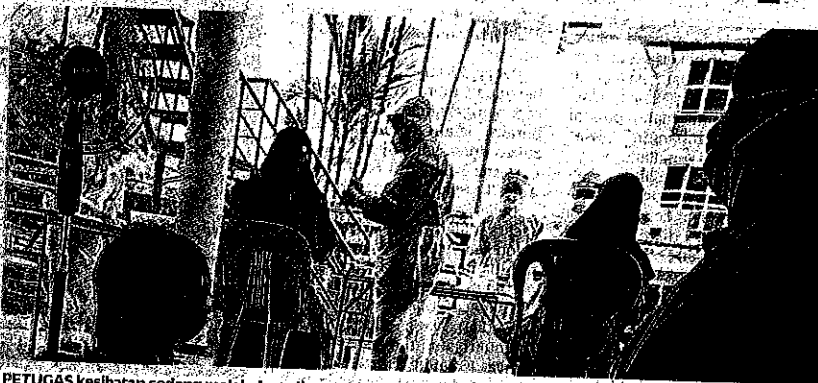
PETUGAS kesihatan sedang melakukan ujian saringan Covid-19 ke atas penghuni Rumah Perlindungan Baitus Solehah di Skudai, Johor Bahru, Sabtu lalu.

"Bagaimanapun punca wabak ini bermula belum diketahui dan pihak Kementerian Kesihatan (KKM) masih melakukan siasa-