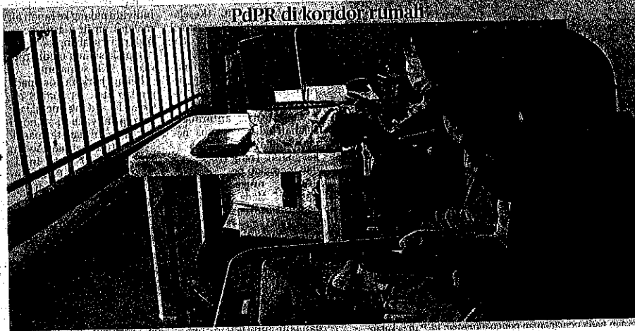
PdPR di koridor rumah

"Kluster terakhir dikenal pasti adalah Kluster Industri Serkam yang dilaporkan di Jasin dan Melaka Tengah, Melaka hasil saringan bersasar, di sebuah kilang dengan 69 kes dikesan positif dalam kluster berkenaan," katanya.